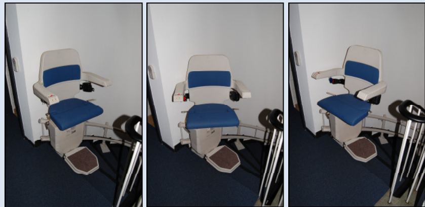
Automatisch drehender Sitz am oberen Ende der Fahrschiene

Der Treppenlift KT 260 für kurvige Treppen ist ein äußerst bewährter Treppenlift. Er ist mit zahlreichen Sicherheits-Merkmalen ausgestattet und erfüllt die strengen europäischen und deutschen Bestimmungen. Die akkubetriebene Fahrinheit wird an den Haltepunkten automatisch aufgeladen. Dadurch funktioniert der Lift auch bei Stromausfall. Das bewährte 2-Rohr System kann an der Treppe oder an der Wand befestigt werden. Die Schiene ( reconditioned ) kann auf beiden Seiten der Treppe montiert werden. Der Dreh-Sitz erleichtert den Ausstieg am oberen Ende der Treppe. Die Fahrt mit dem Treppenlift erfolgt mittels der Drucktasten-Steuerung, die sich an der Armlehne befindet. Der sehr sanfte Start und Stopp garantieren eine durchweg ruhige Fahrt. Der Lift ist abschließbar und dadurch gegen unbefugte Benutzung gesichert. Die Polster sind in vielen ansprechenden Farben wählbar.