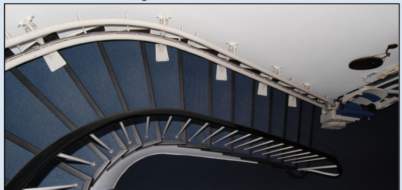
Einbaubeispiel: Außenläufer mit Sonderkurve